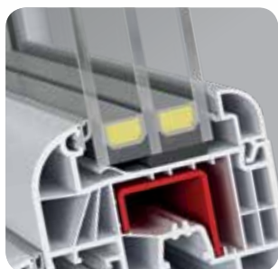
technologia klejonej szyby „bonding inside” to szereg dodatkowych korzyści

Na przykład, okno referencyjne o wymiarach 1230 mm x 1480 mm, przy zastosowaniu pakietu szybowego o współczynniku U_g=0,5 \text{ W/m}^2\text{K} osiąga współczynnik izolacji termicznej wynoszący U_w=0,76 \text{ W/m}^2\text{K} . To nawet o 45% lepsze właściwości niż w przypadku najczęściej kupowanych okien na bazie profili pięciokomorowych z szybą o współczynniku U_g=1,1 \text{ W/m}^2\text{K} .