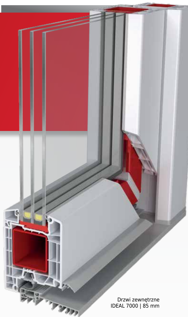
Drzwi zewnętrzne IDEAL 7000 | 85 mm

Seria IDEAL 7000 otwiera nowe możliwości w produkcji drzwi zewnętrznych. Dzięki wielokomorowej budowie, głębokości zabudowy 85 mm i możliwości stosowania pakietów szybowych i wypełnień o szerokości do 50 mm udało się znacząco poprawić parametry izolacyjności termicznej konstrukcji, osiągając wartość U_f do 1,2 W/m 2 K.